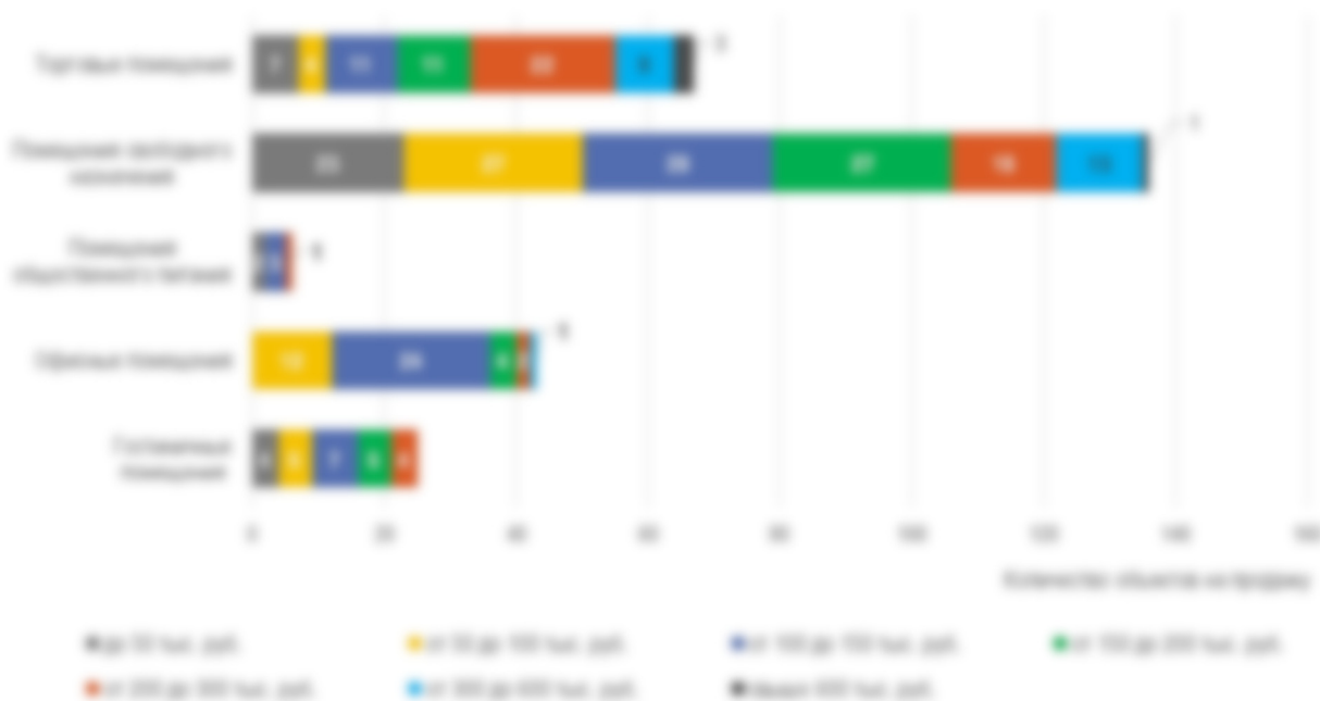
Рисунок 9. Количество предложений объектов на продажу по ценовым группам за 1 кв.м. площади в разрезе сегментов рынка