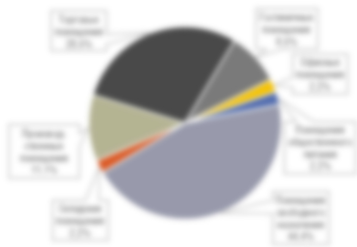
Рисунок 5. Сегментация спроса на приобретение сопоставимых объектов в окружении

Другие категории площадей характеризуются незначительным спросом, при этом имеется спрос на производственные помещения.