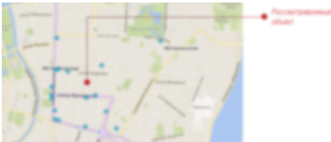
Рисунок 16. Расположение объектов культуры на целевой территории