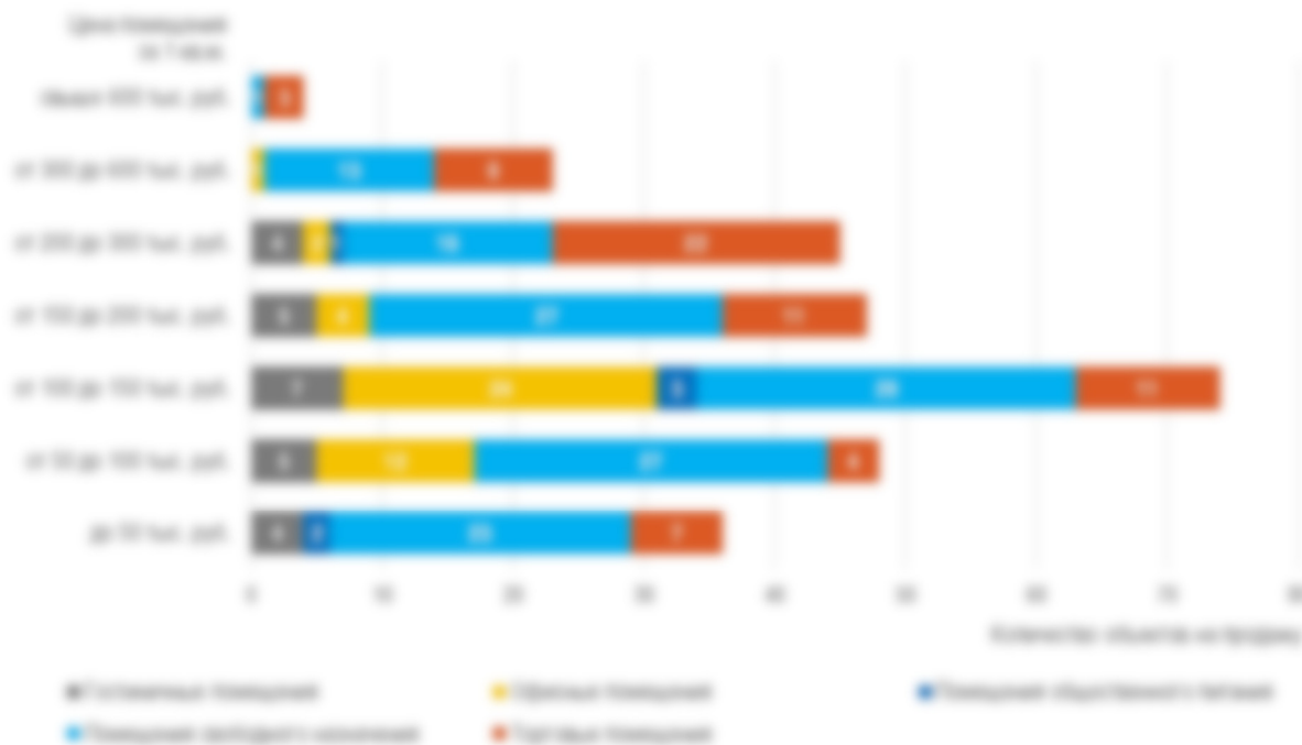
Рисунок 8. Количество предложений объектов на продажу по сегментам рынка в разрезе ценовых групп