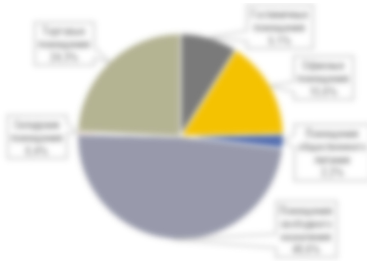
Рисунок 4. Сегментация предложений о продаже сопоставимых объектов в окружении

Другие категории площадей характеризуются незначительным количеством предложений.